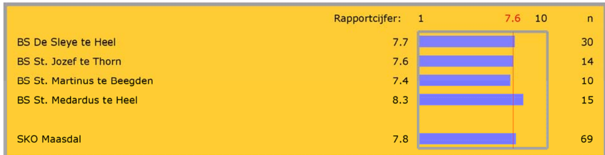
Figuur 1: Rapportcijfers (vraag 107)

De enquête geeft een duidelijk beeld van de tevredenheid van de personeelsleden met de scholen waarop zij werkzaam zijn.