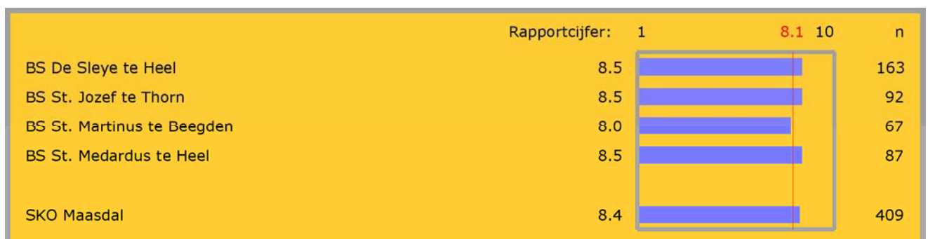
Figuur 1: rapportcijfers

In figuur 1 staat voor elk van de scholen het rapportcijfer vermeld. Achter de grafiek staat in kolom 'n' steeds het aantal respondenten vermeld dat de vraag heeft beantwoord. De rode verticale lijn representeert het rapportcijfer dat de leerlingen in de referentiegroep aan hun school gaven.