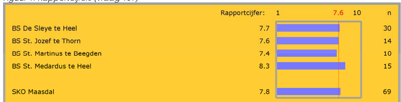
Figuur 1: Rapportcijfers (vraag 107)

De enquête geeft een duidelijk beeld van de tevredenheid van de personeelsleden met de scholen waarop zij werkzaam zijn.